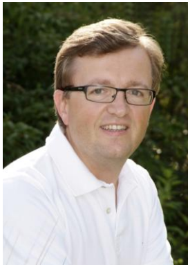
Thomas Peinbauer © Foto Kirschner

Für die redaktionelle Berichterstattung stellen wir Ihnen diese Bilder gerne honorarfrei zur Verfügung.: