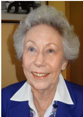
Enid Segall © MES photography