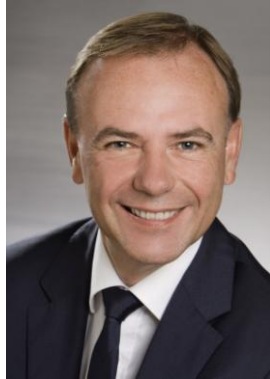
Gerald Bischof