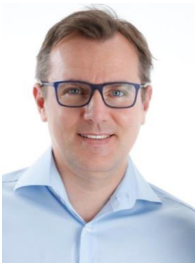
Dieter Busenlechner © Sleep & Smile Center