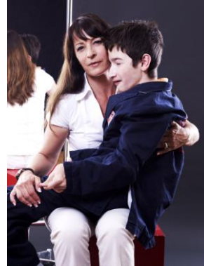
Carmen Little und Robie