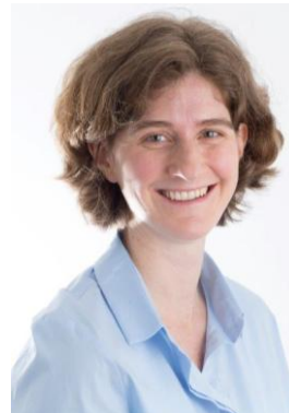
Anna Csokay © Sleep & Smile Center