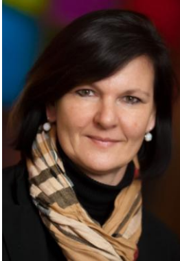
Andrea Krischke-Bischof

Für die redaktionelle Berichterstattung stellen wir Ihnen diese Bilder gerne honorarfrei zur Verfügung. Sie finden sie in drucktauglicher Qualität auf dem beiliegenden USB-Stick. Bitte verwenden Sie die Bilder ausschließlich für die Berichterstattung und im Zusammenhang mit dieser Presseinformation (und Copyrights-Angaben).